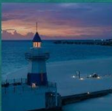
Light House Restaurant