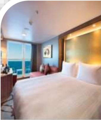
Oceanview Stateroom with Balcony