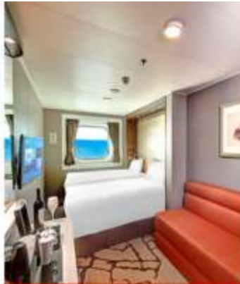
Oceanview Stateroom with Window