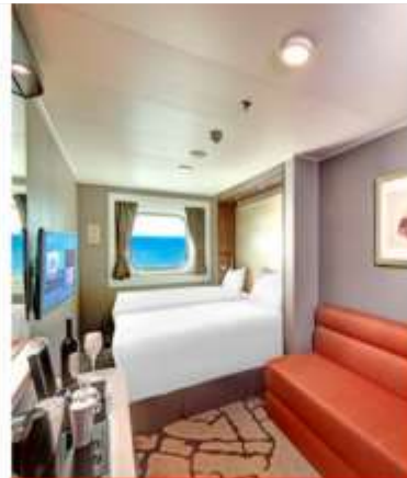
Oceanview Stateroom with Window