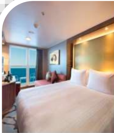
Oceanview Stateroom with Balcony