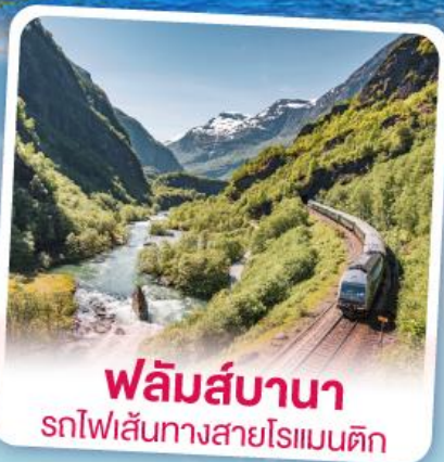
พหลิมส์บานา รถไฟเส้นทางสายโรแมนติก