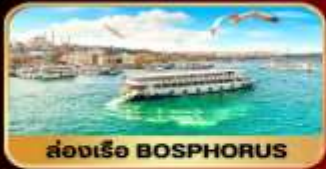
ล่องเรือ BOSPHORUS