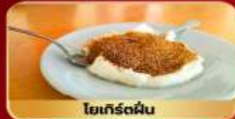
โยเกิร์ตผัด