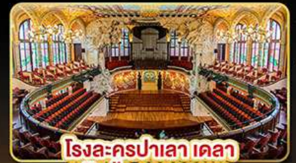
โรงละครปาเลา เดลา มูสิกา คาคาลานา