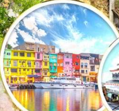
ท่าเรือสายรุ้ง