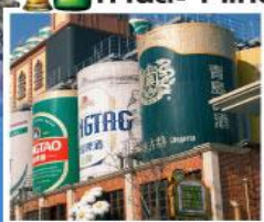
พรมักที่โรงแรมเบียร์ชิงเต่า