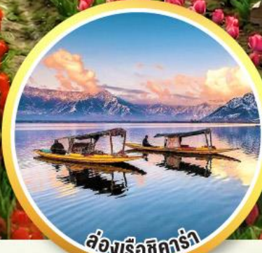
ล่องเรือชิคร่า