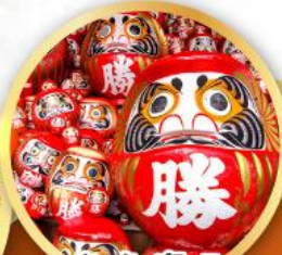
วัดคัตสึโฮจิ (วัดดามารุ)

ชมความงามของกำแพงหิมะ เส้นทางสายอัลไพน์ทาเคยาม่า (JAPAN ALPS SNOW WALL)