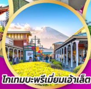
โทเกมบะพรีเมียมเฮ้าส์