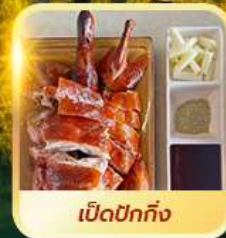
เปิดปอกกิ้ง