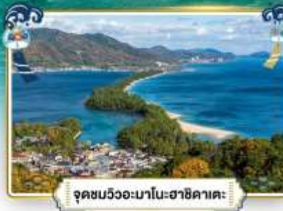
จุดชมวิวงอะมาโนฮาชิคาเตะ