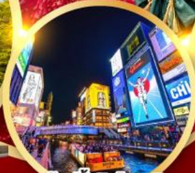
ช้อปปิ้งชินโซบาช