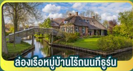
ล่องเรือหมู่บ้านไรด์นทีกีร์ชุน