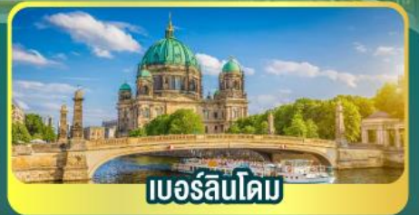
เบอร์ลินโดม