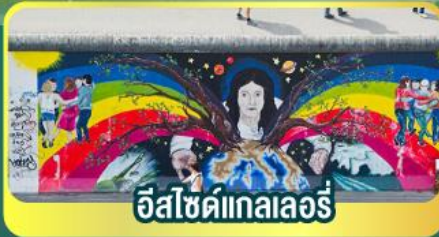
อิชไซด์เกาลเลอร์