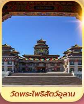
วัดพระโพธิสัตว์จุลาน