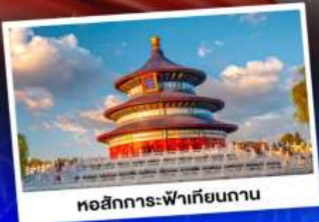
หอสังเกตการณ์เทียนถาน