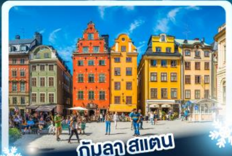
🏡 กับลาสแตน