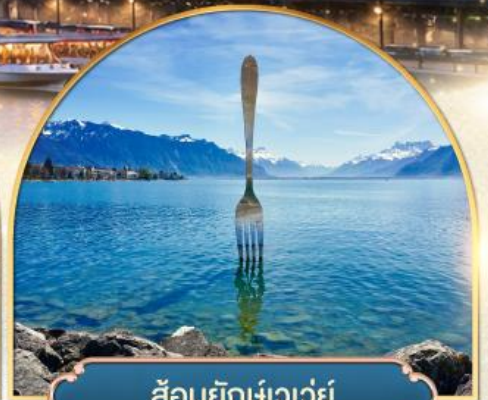
ล้อมยักเขาวัว