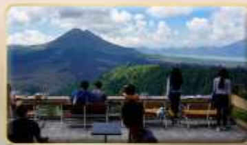
หมู่บ้านคินตามณี