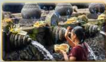
วัดน้ำพุศักดิ์สิทธิ์