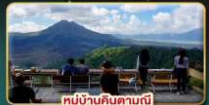
หมู่บ้านคินตามณี