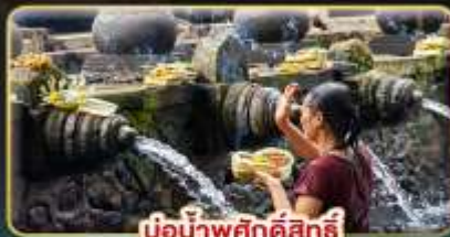
บ่อน้ำพุศักดิ์สิทธิ์