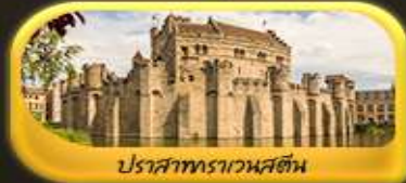
ปราสาทราเวนสตัน