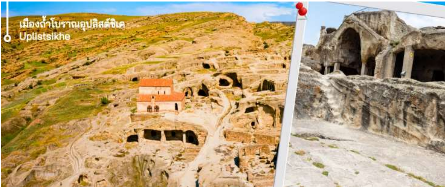
เมืองถ้ำโบราณอูปลิสต์ซิกเค Uplistsikhe

นำท่านเดินทางชมถ้ำโบราณ เมืองถ้ำโบราณอูปลิสต์ซิกเค ได้รับการระบุโดยนักโบราณคดีว่าเป็นหนึ่งในแหล่งที่อยู่อาศัยในเมืองที่เก่าแก่ที่สุดในจอร์เจีย ถ้ำส่วนใหญ่ไม่มีการตกแต่งใดๆ แม้ว่าโครงสร้างขนาดใหญ่บางแห่งจะมีเพดานโค้งแบบอุโมงค์ที่แกะสลักหินเลียนแบบท่อนซุง โครงสร้างขนาดใหญ่บางแห่งยังมีช่องเล็กๆ อยู่ด้านหลังหรือด้านข้าง ซึ่งอาจใช้สำหรับพิธีกรรม ด้านหน้าของห้องโถงพิธีกรรมขนาดใหญ่ทางตอนใต้ตกแต่งด้วยซุ้มโค้งแบบโรมันที่มีหน้าจั่ว มหาวิหารในศตวรรษที่ 6 ส่วนใหญ่แกะสลักเข้าไปในหิน ยกเว้นกำแพงด้านใต้ที่สร้างจากหิน ที่จุดสูงสุดของบริเวณนั้นมีมหาวิหาร คริสเตียน ที่สร้างด้วยหินและอิฐในศตวรรษที่ 9-10 การขุดค้นทางโบราณคดีได้ค้นพบสิ่งประดิษฐ์มากมายจากยุคต่างๆ รวมถึงเครื่องประดับทองคำ เงิน และทองสัมฤทธิ์ ตลอดจนตัวอย่างเครื่องปั้นดินเผาและประติมากรรม สิ่งประดิษฐ์เหล่านี้จำนวนมากได้รับการเก็บรักษาไว้ในพิพิธภัณฑ์แห่งชาติในกรุงทบิลีซี