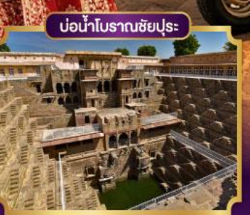
ม่อน้ำโบราณชัยปุระ

เดินทาง 25-30 พ.ย.69 23-28 ธ.ค.69 หยุดปีใหม่ 29 ธ.ค.-03 ม.ค.70