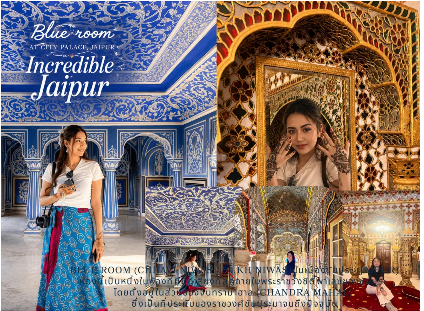
BLUE ROOM (CHANDRA NIWAS) AT CITY PALACE, JAIPUR ห้องนี้เป็นหนึ่งในห้องที่สวยงามที่สุดในพระราชวังซิตี้พาลาซของเมือง โดยตั้งอยู่ในส่วนของจันทรมาฮาล (CHANDRA MAHAL) ซึ่งเป็นที่ประทับของราชวงศ์ชัยปุระมาจนถึงปัจจุบัน

กลางวัน รับประทานอาหารกลางวัน ณ ที่ห้องอาหาร (มื้อที่ 4) จากนั้นเชคเอาท์ สัมภาระ ออกเดินทางสู่เมือง จอดห์ปุร์ ใช้เวลานั่งรถ 5.30 ชม.