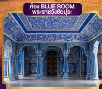
ห้อง BLUE ROOM พระราชวังชัยปุระ