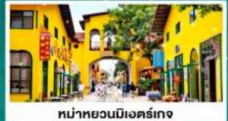
หมู่บ้านมื่อเอ๋อร์เกง