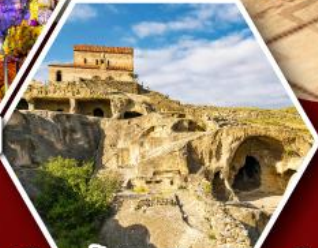
เมืองถ้ำอพลิสตซิคห์

พัก Rooms Hotel โรงแรมวิวหลักล้านของเทือกเขาคอเคซัส