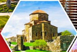
วิหารกอรี