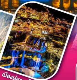
เมืองฝูหลงเจิ้น